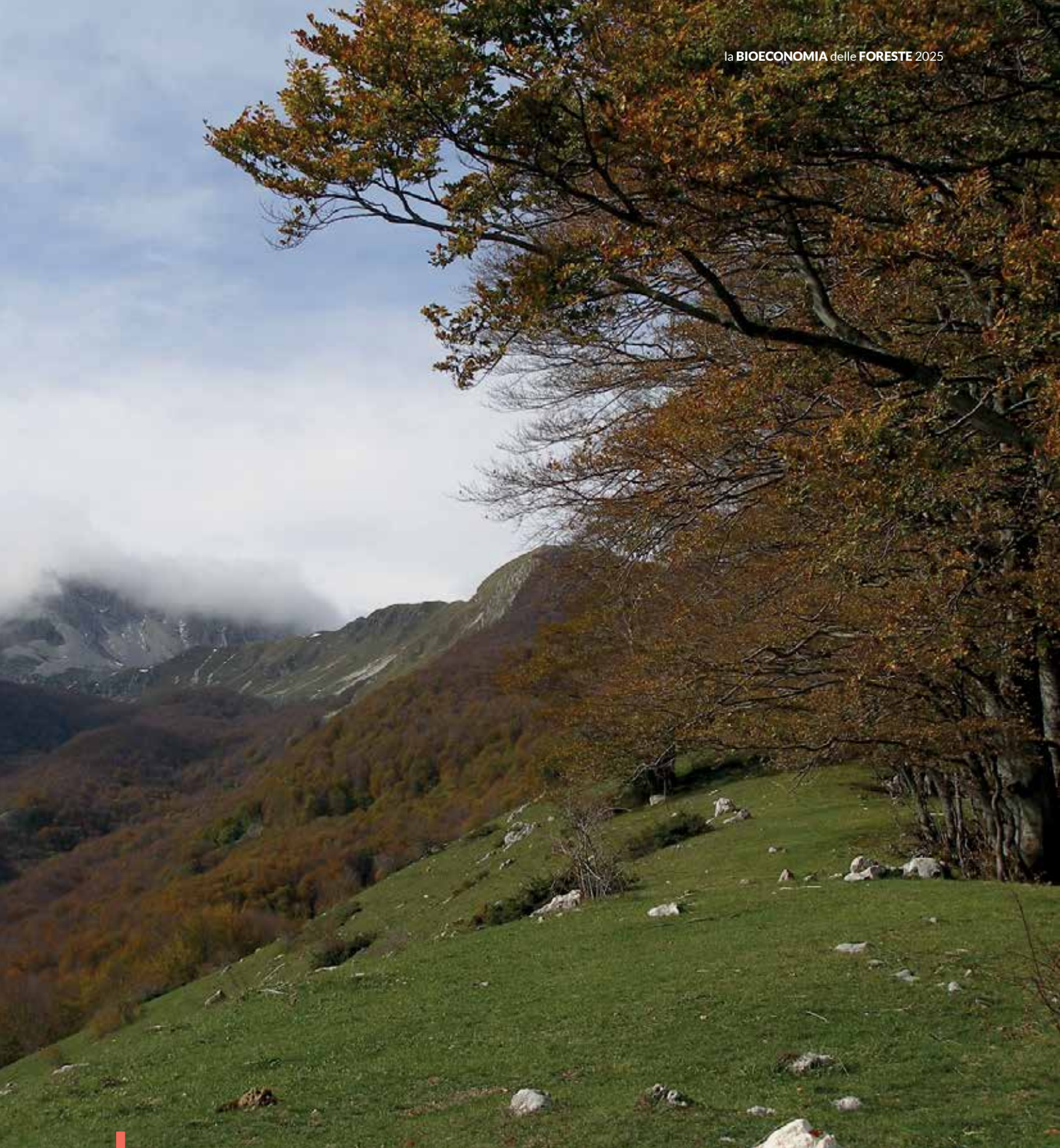
Faggeta Monte Meta

massa arborea, accumulata per secoli, e il suolo continuano a immagazzinare quantità significative di carbonio anche nelle fasi avanzate del ciclo vitale della foresta.