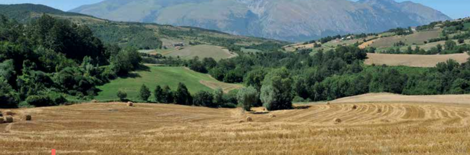
Parco nazionale della Majella

che, secondo l'Interpol, rappresenta la seconda fonte di reddito per la criminalità organizzata mondiale dopo il traffico di stupefacenti.