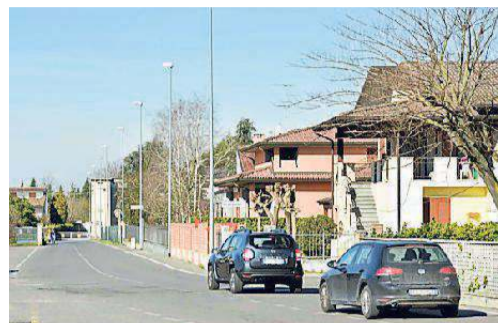
Via Barbieri, la velocità eccessiva è un grave problema

SONO SPESSO CHIUSI, POCHI I GIOCHI PER I BAMBINI