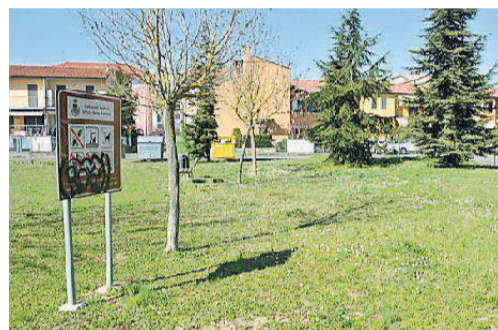
I giardini di via Cisotti, scarseggiano i giochi per bambini

ne. In più, tutt'attorno ci sono erbacce e immondizia. Poca cura anche ai giardini pubblici, cui si accede dall'angusta via Cisotti, con un unico gioco per bambini e qualche vecchia altalena.